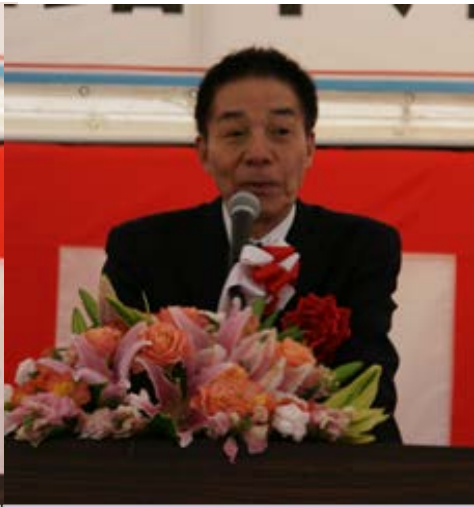
有明海沿岸道路建設促進 福岡県期成会 古賀特別顧問の祝辞