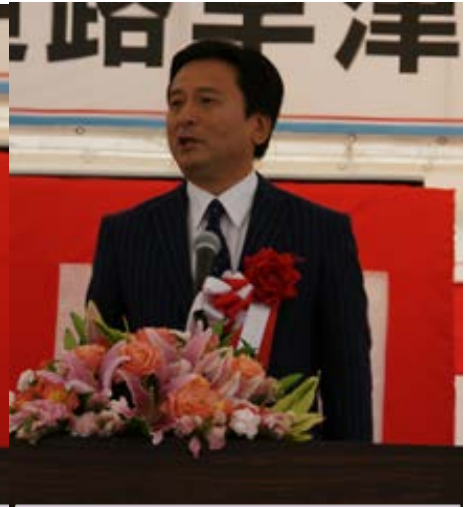
山口佐賀県知事の祝辞