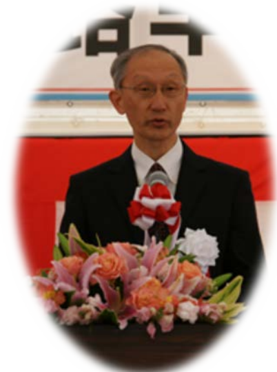
鈴木九州地方整備局長の挨拶