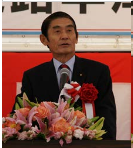
今村衆議院議員の祝辞