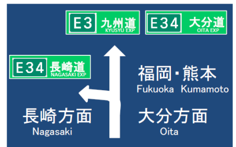
ナンバリング整備イメージ