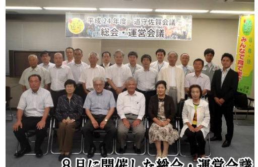
8月に開催した総会・運営会議