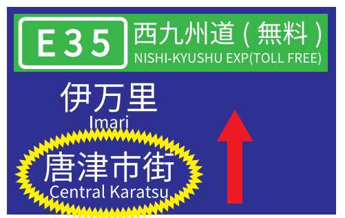
例) 二丈鹿家ICの案内標識の表示変更