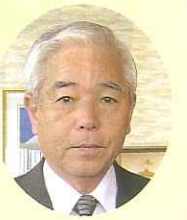
壱岐市長 長田 徹

壱岐市は、玄界灘に浮かぶ、海とみどりに囲まれた自然豊かな島で、よく「箱庭のようだ」と例えられる、美しい島です。また、国の特別史跡である「原の辻遺跡」などの歴史的な遺産にも恵まれるとともに、人情味豊かな風土を有し、麦焼酎や壱岐牛をはじめ、新鮮な海産物や豊かな農産物などが豊富にある、グルメの島でもあります。