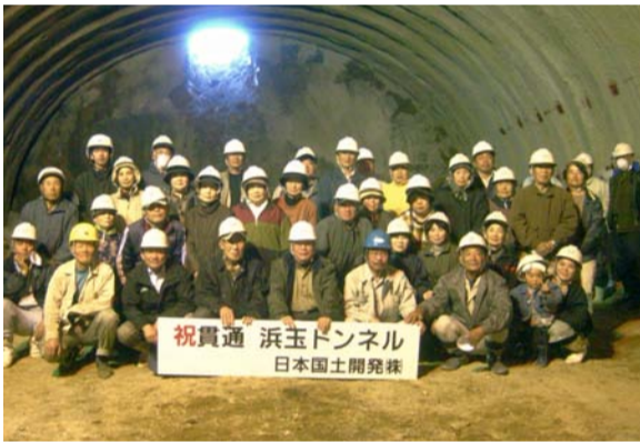
地域住民の方々と記念撮影をしました。