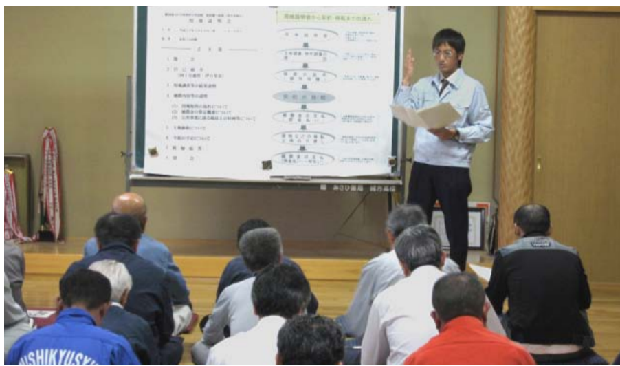
▲用地説明会の様子

今後、関係者の方のお宅にお伺いし、用地買収のご相談をさせていただきますので、ご理解とご協力を宜しくお願いいたします。