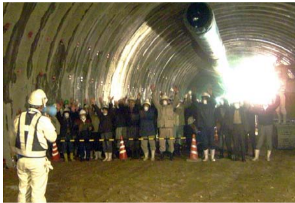
貫通の瞬間、みんなで万歳〜!