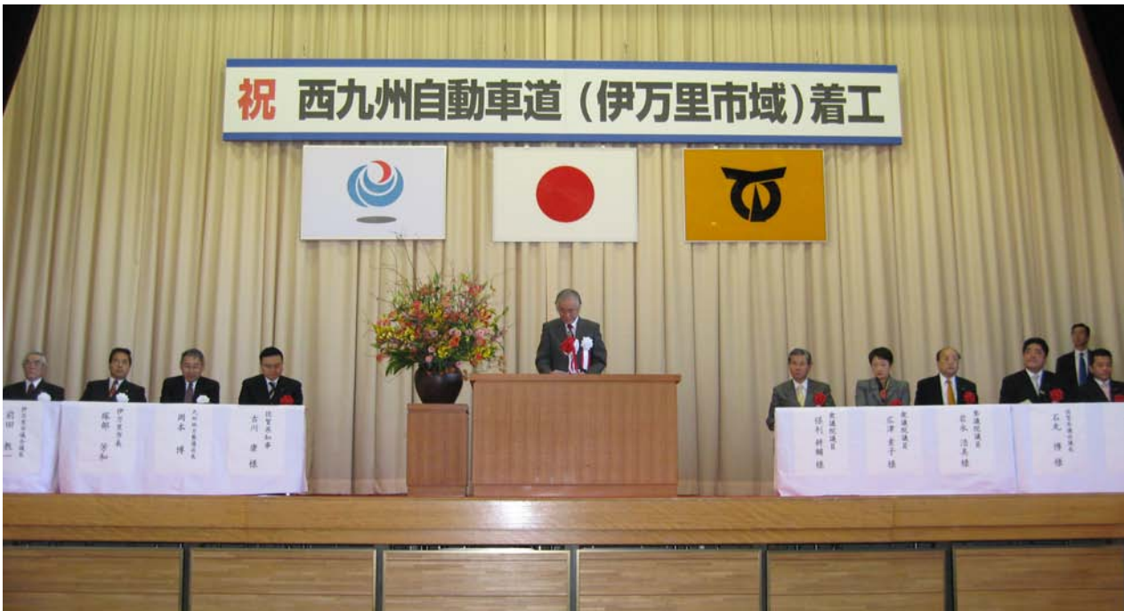
佐賀国道事務所長の式辞

この式典は、西九州自動車道の建設に伴い、用地を提供して頂いた方への謝意を表すとともに、今後、周辺住民をはじめとする沿線地域の皆様へ、工事に対するご理解とご協力を呼びかけ、今後の事業を円滑に進めることを目的として開催されたもので、これにより工事が本格的にスタートすることになります。式典前のオープニングアトラクションとして、伊万里市府招浮立保存会の皆様による佐賀県指定重要無形民俗文化財「府招浮立」から3演目が披露され、勇壮華麗な演舞で来場者を魅了しました。