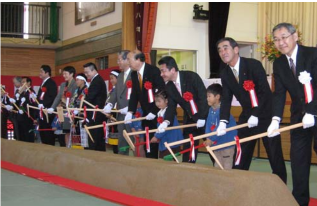
関係者と地元子ども達による鍬入れ式