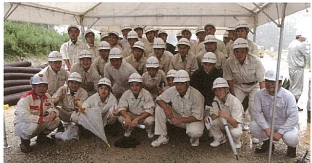
▲集合写真(鳥栖工業高校)

また、平成25年7月10日には、土木や、地域づくりに興味を持ったための社会勉強の一環として、南波多中学校の生徒を対象に現場見学会を開催しました。