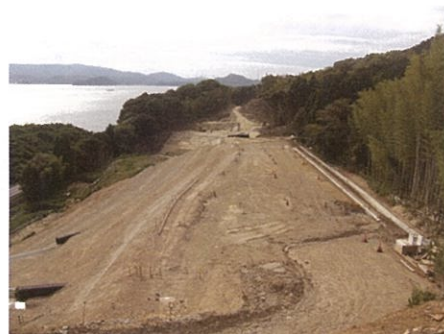
▲伊万里松浦道路<久原地区> (伊万里市山代町久原)