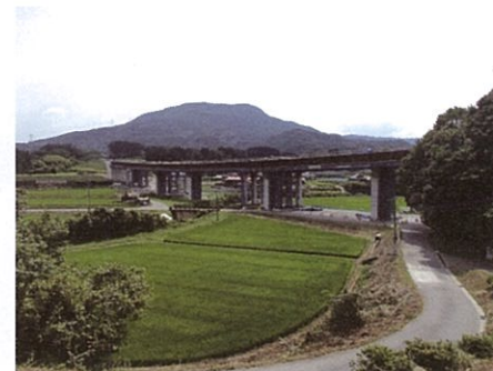
▲唐津伊万里道路<(仮称)板治川橋> (伊万里市南波多町谷口)