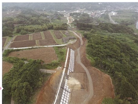
▲伊万里松浦道路<立岩地区> (伊万里市山代町立岩)