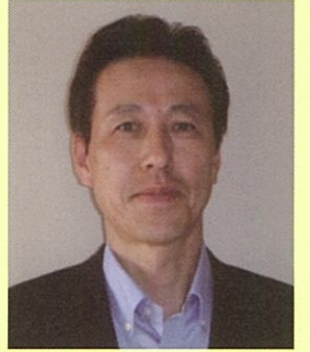
国土交通省 九州地方整備局 佐賀国道事務所長