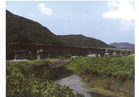
▲唐津伊万里道路<下平野橋> (唐津市北波多山彦)