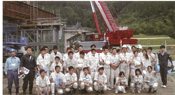
▲集合写真(唐津工業高校)