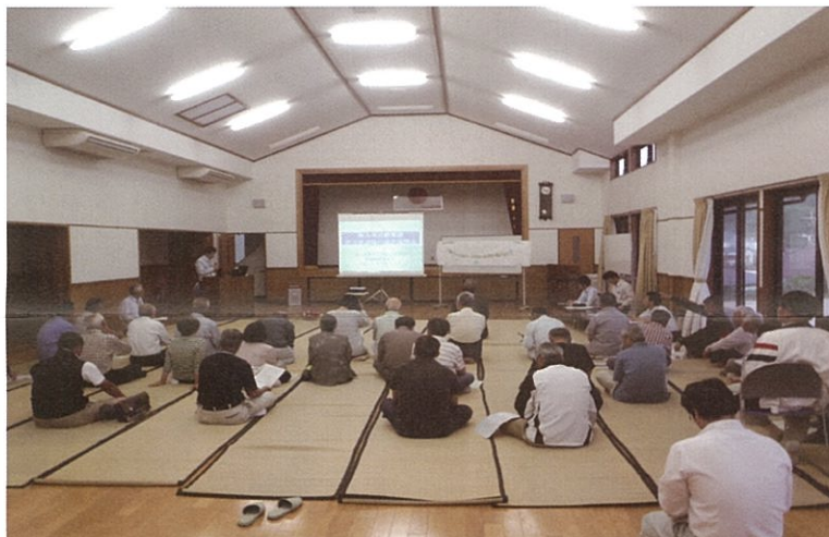
▲地元説明会の様子(脇田公民館にて)

平成25年度は、(仮称)伊万里中I.C.～(仮称)伊万里西I.C.間において設計説明会を行う予定といたしますので、関係者の皆様におかれましては、引き続き事業へのご理解とご協力を宜しくお願いいたします。