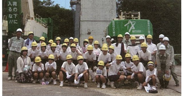
▲集合写真(南波多中学校)