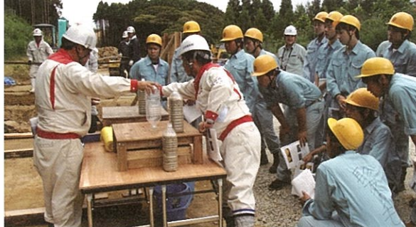
▲真剣に説明を聞く生徒達(伊万里農林高校)