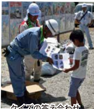
クイズの答え合わせ