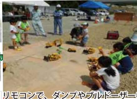
リモコンで、ダンプやブルドーザーを操縦