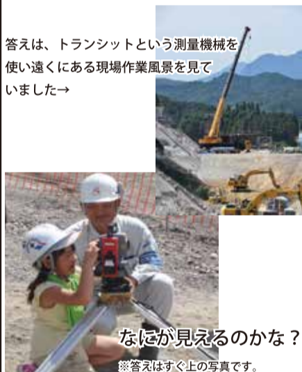
答えは、トランシットという測量機械を使い遠くにある現場作業風景を見ていました→