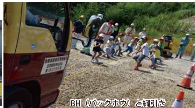
BH (バックホウ) と綱引き