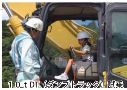
10.t DT (ダンプトラック) 試乗