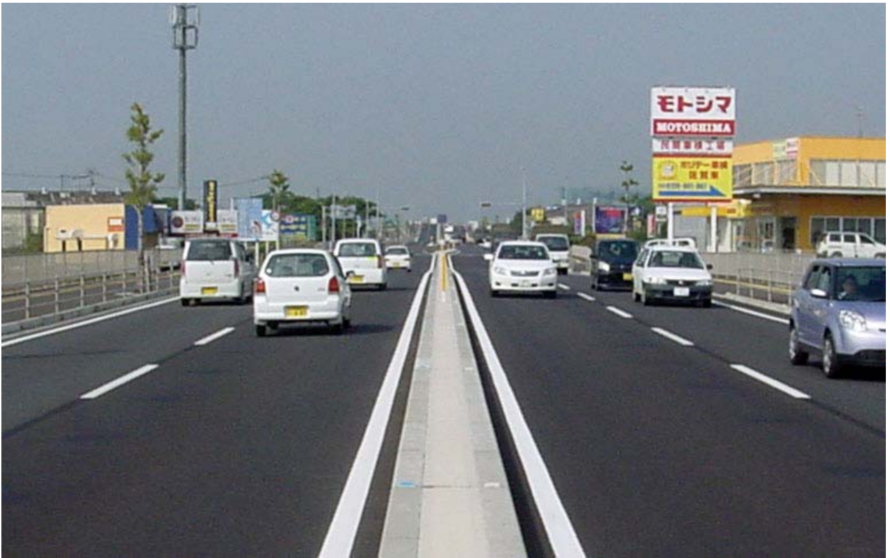
▲ 兵庫町 わかみや 若宮交差点付近より小城・武雄方面を望む（平成22年10月14日撮影）

下の写真は、9月30日に交通開放した区間（堀立西交差点～若宮交差点）の様子です。