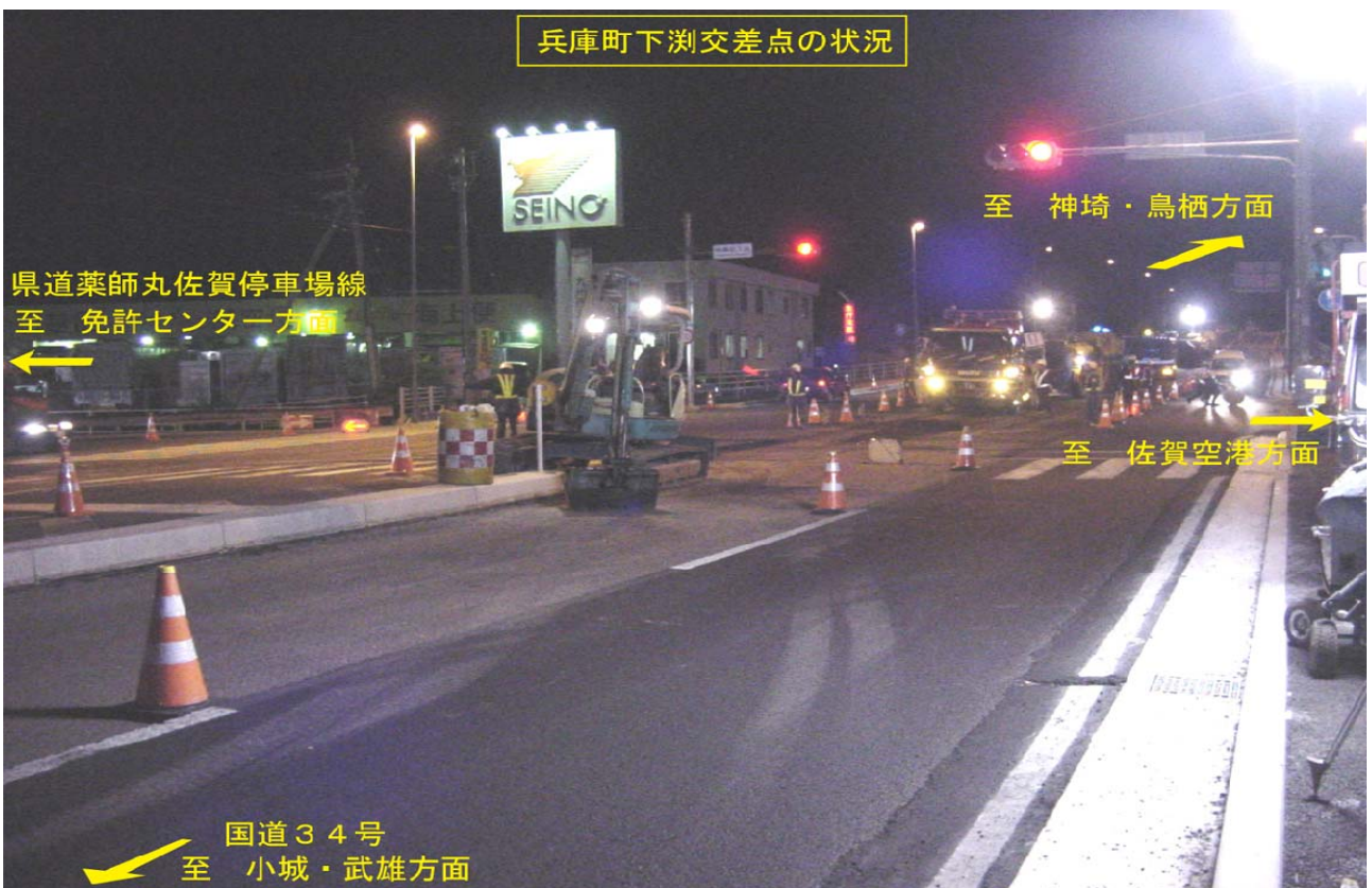
▲兵庫町下湊交差点付近より神埼・鳥栖方面を望む（平成22年10月18日撮影）

下の写真は、工事区間の終点となる兵庫町下湊交差点付近における夜間作業（舗装工事）の様子です。