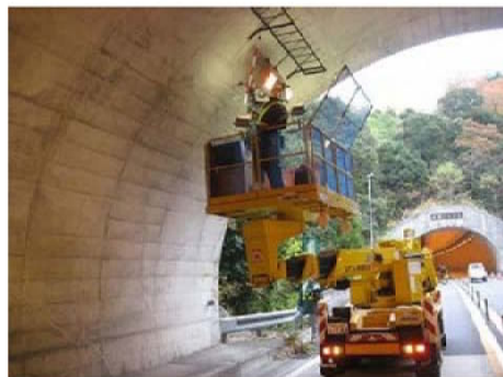
ケーブルラック点検状況