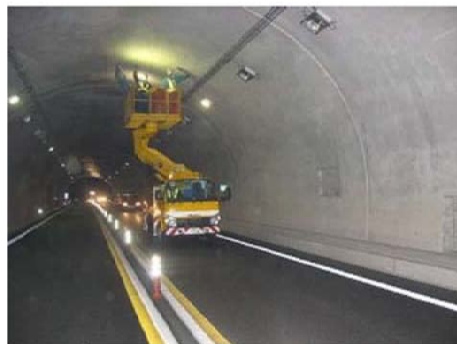
ケーブル固定部点検状況