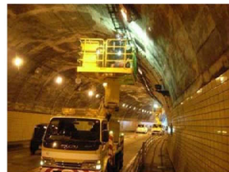
ケーブルラック点検状況