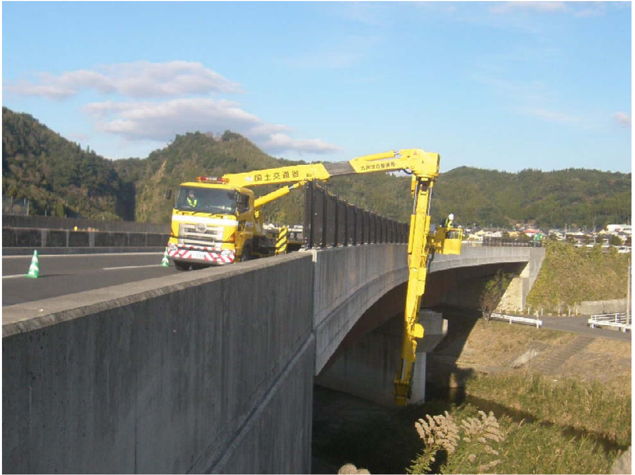
橋梁点検車による近接状況調査作業状況