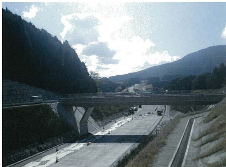
伊万里市南波多町谷口地区(11月末の状況)