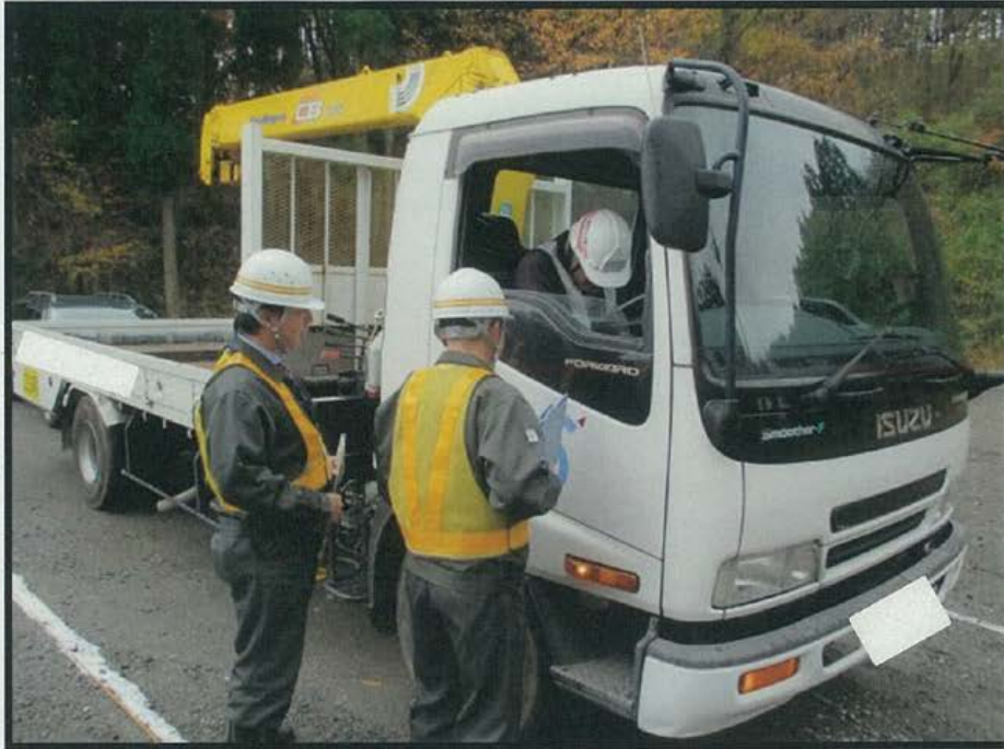
移動必要車両かどうかの確認状況(立ち往生車両)