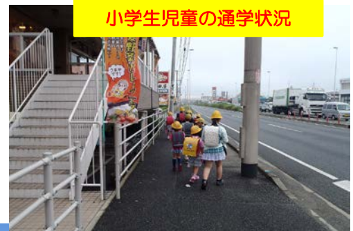
小学生児童の通学状況