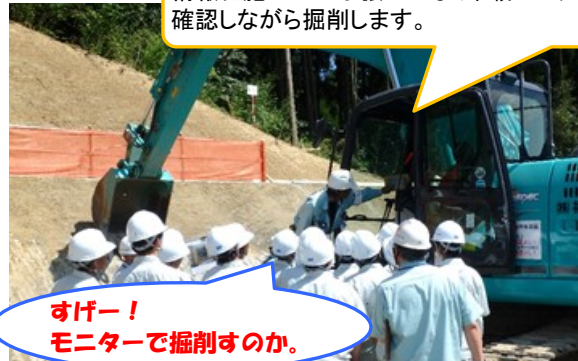
重機を使つてのマシンガイダンス技術について説明