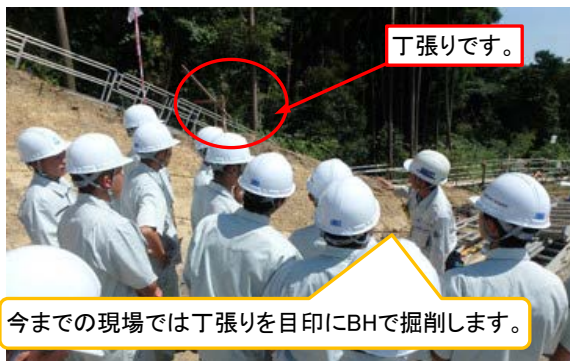
唐津工業高校卒業生からの丁張りについての説明