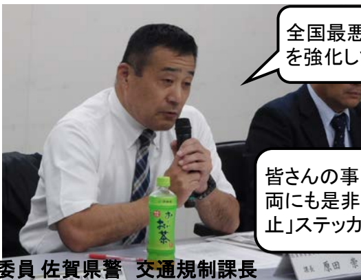
委員 佐賀県警 交通規制課長