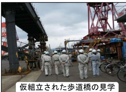
仮組立された歩道橋の見学