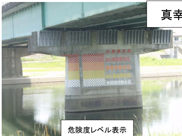
危険度レベル表示