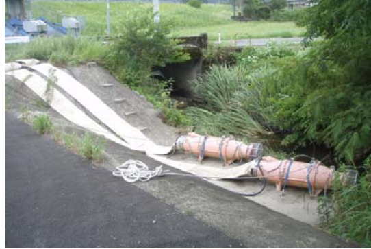
内壱排水樋門(60m 3 /min)