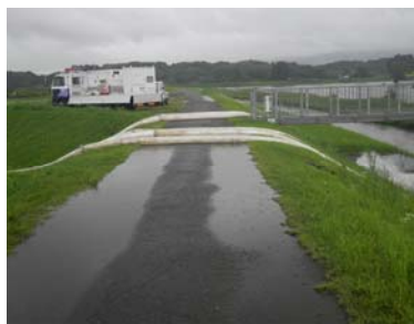
羽月川 下手排水樋門