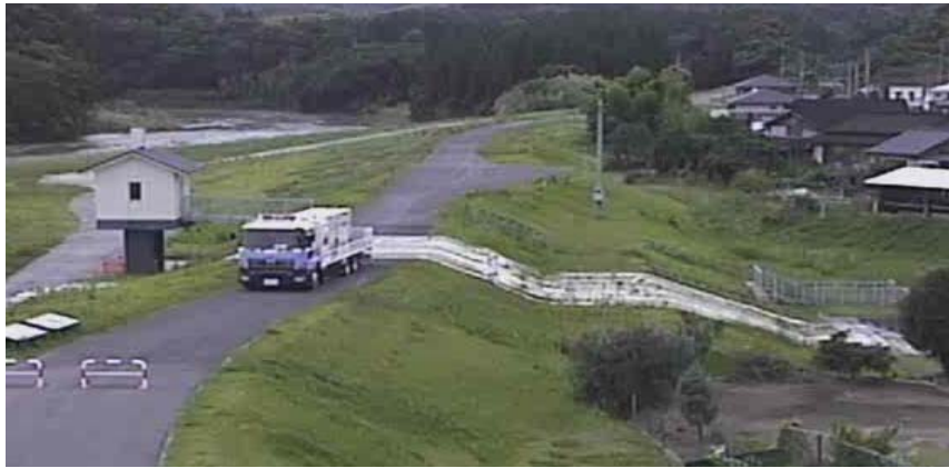
虎居樋門(60m 3 /min)