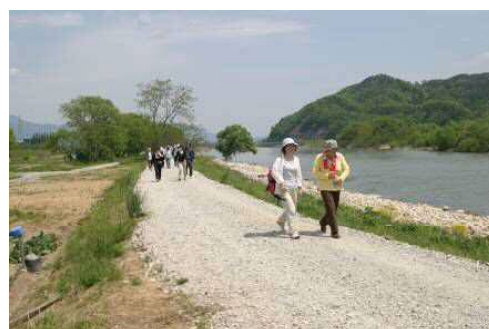
管理用道路をフットパスとして活用（最上川）

ハード支援： 治水上及び河川利用上の安全・安心に係る河川管理施設の整備を通じ、まちづくりと一体となった水辺整備を支援。