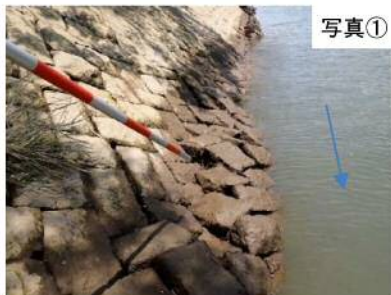
石積みのはらみ出し