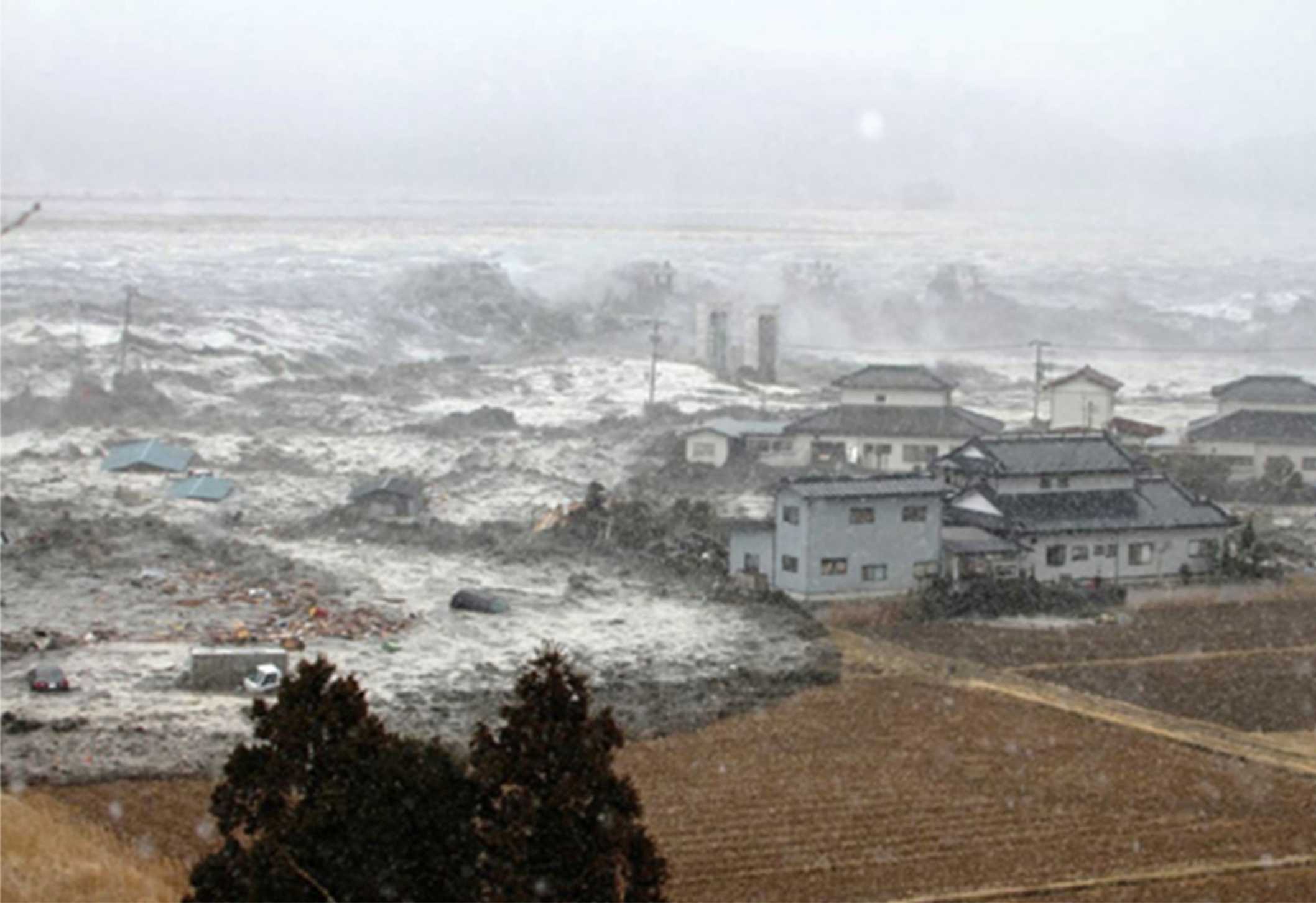
津波(宮城県石巻市)