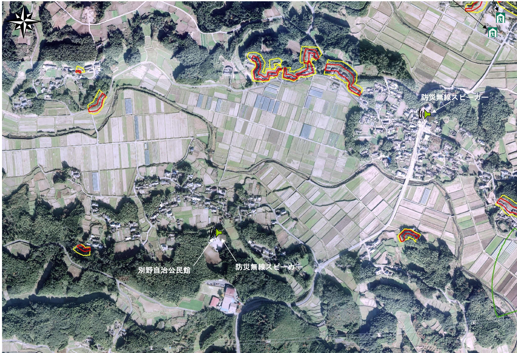
県道薩摩祁答院線