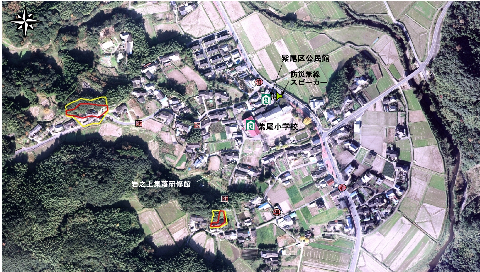
県道鶴田定之段線