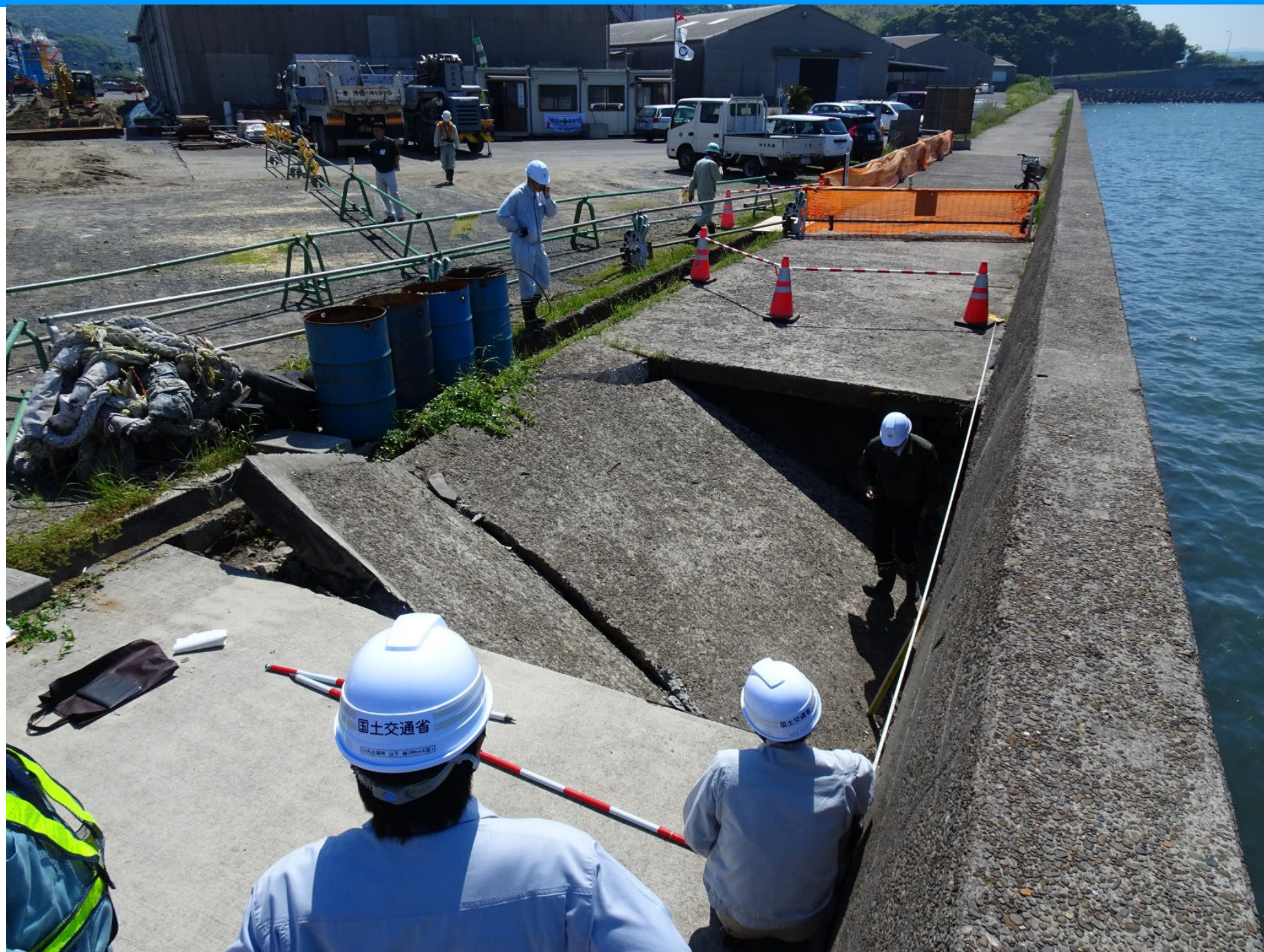
たか しお ひ が い ふ な ま じ ま 高潮の被害(薩摩川内市船間島地区)