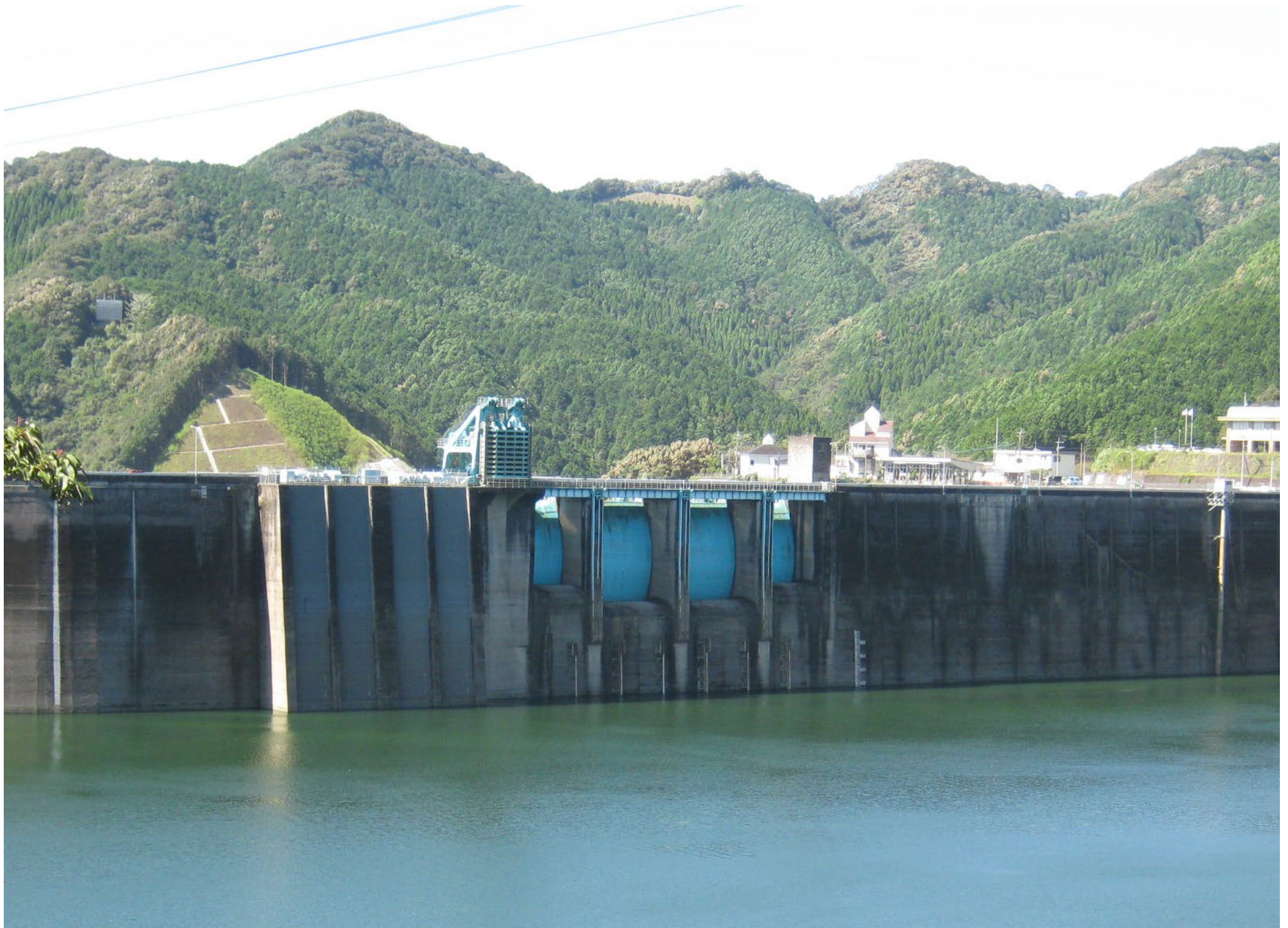
台風15号通過前のダムの貯水位