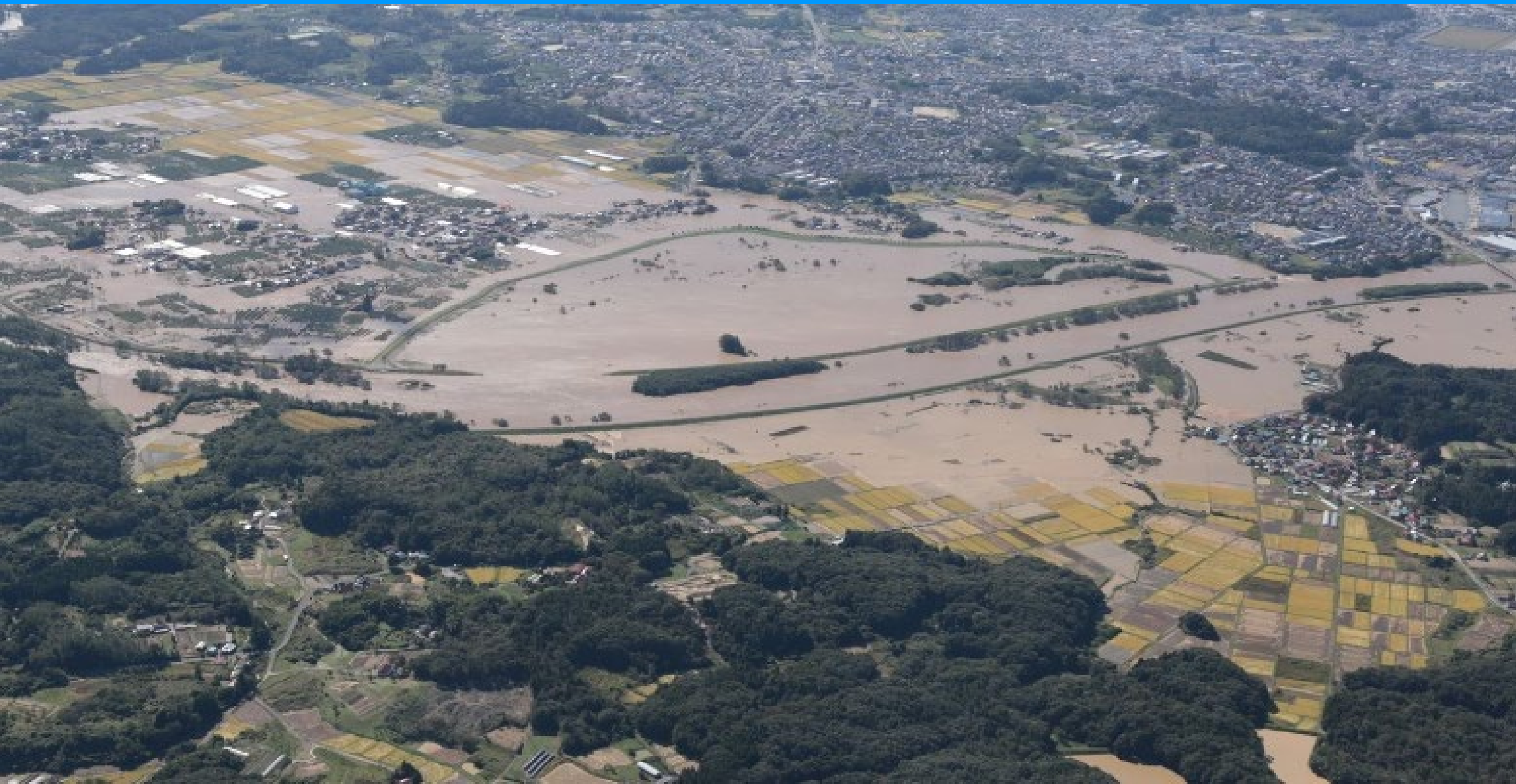
あぶくま 阿武隈川のはんらん(福島県)