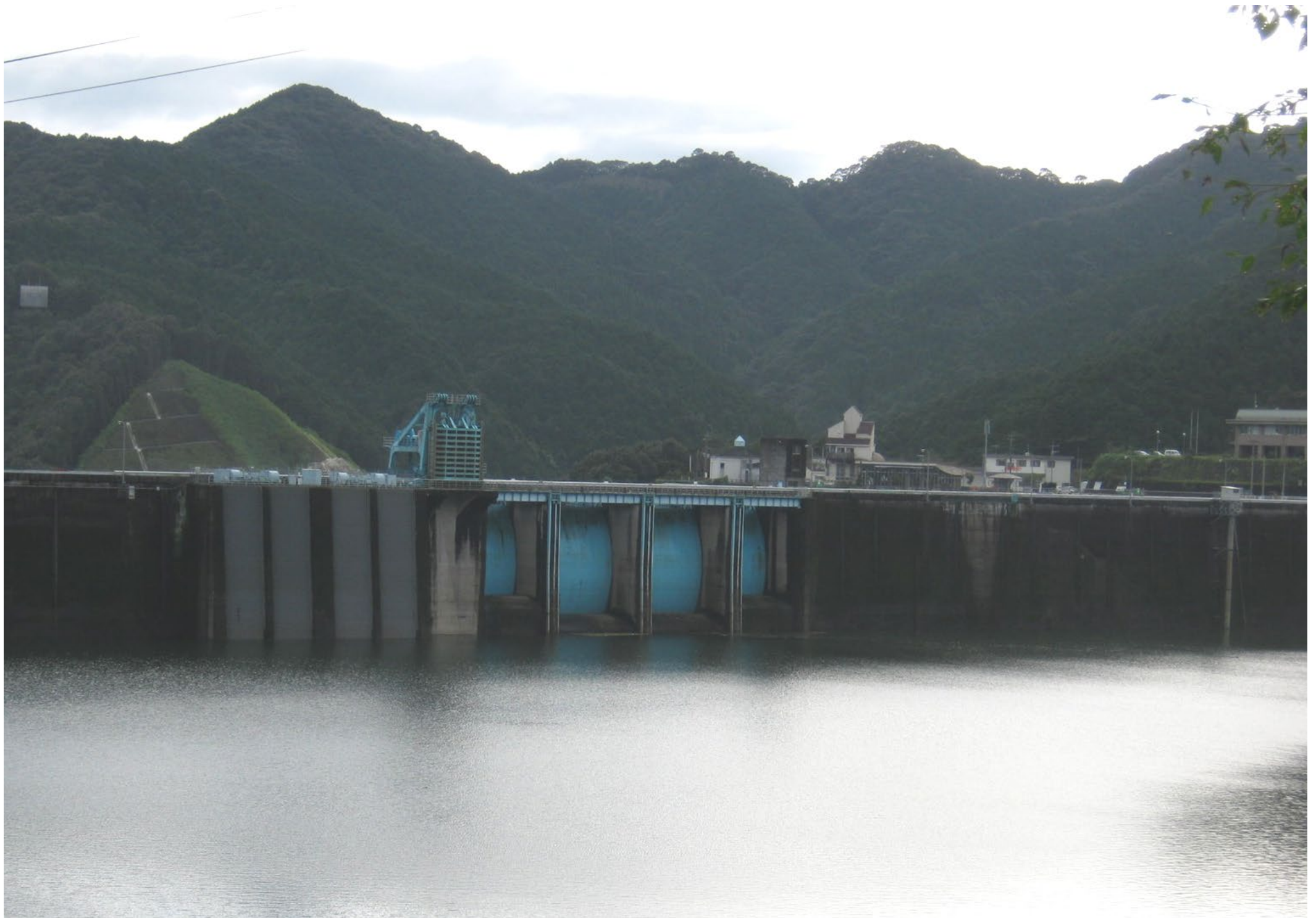
台風15号通過後のダムの貯水位