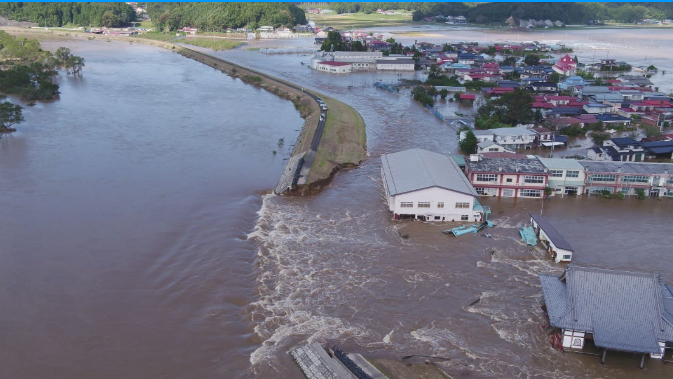
ていぼう けっかい みやぎ 吉田川の堤防の決壊(宮城県)