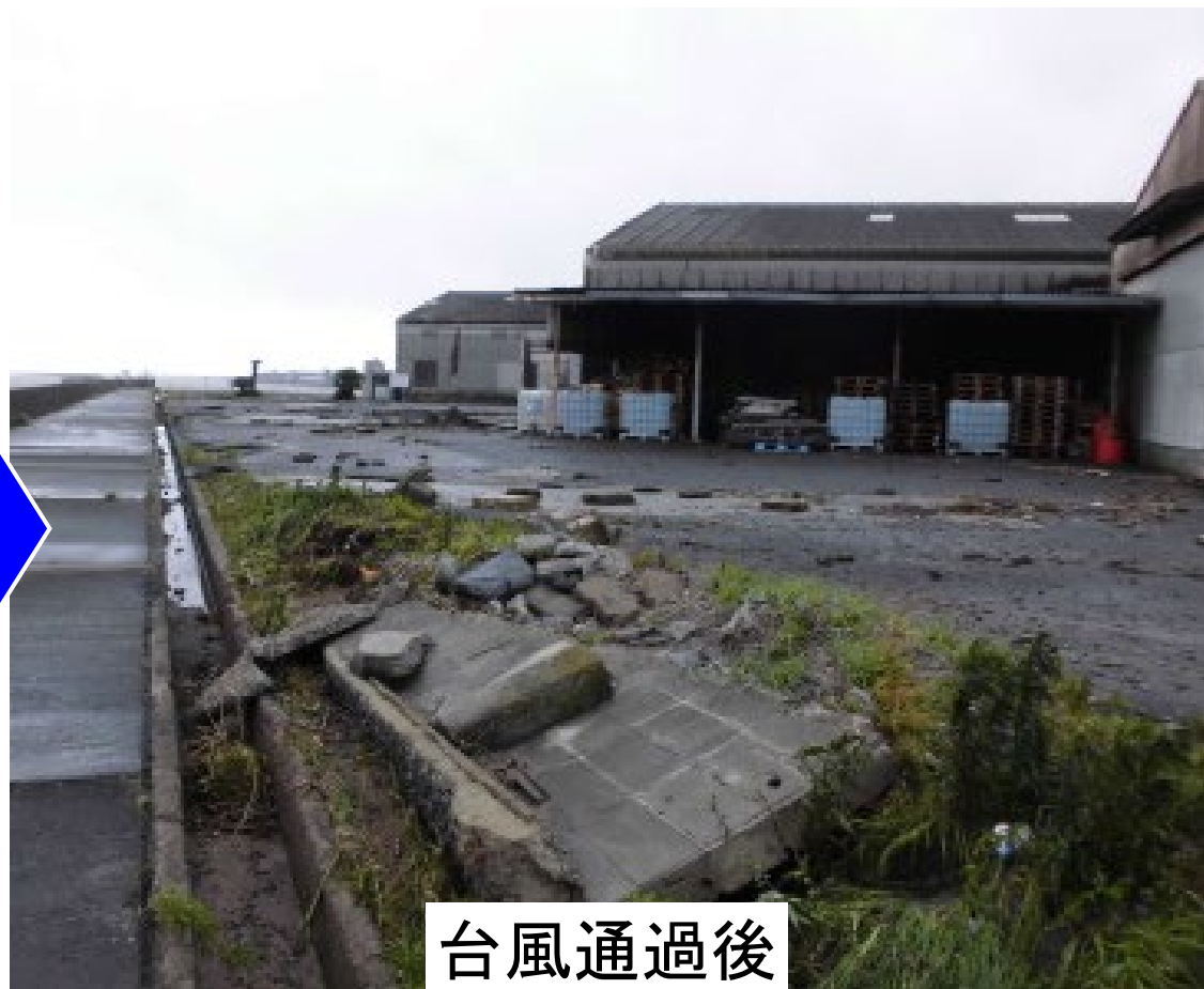
たかしお ひがい 高潮の被害(薩摩川内市船間島地区) ふなま じま