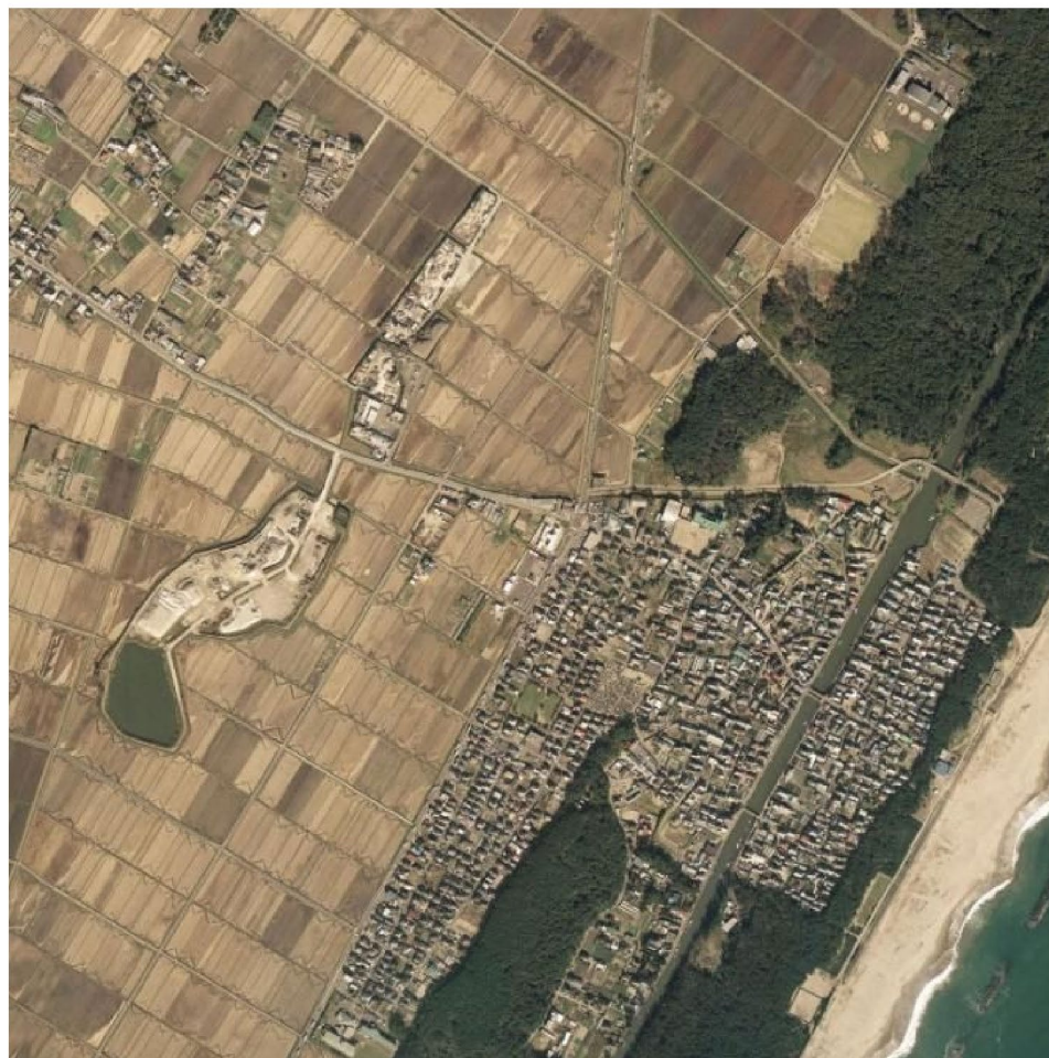
被災前(平成18年10月撮影)