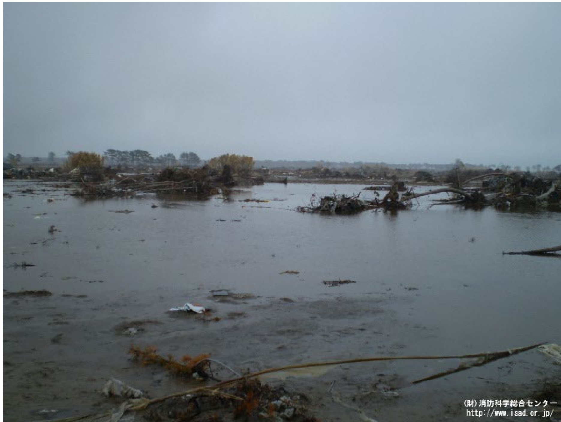
津波により浸水した農地