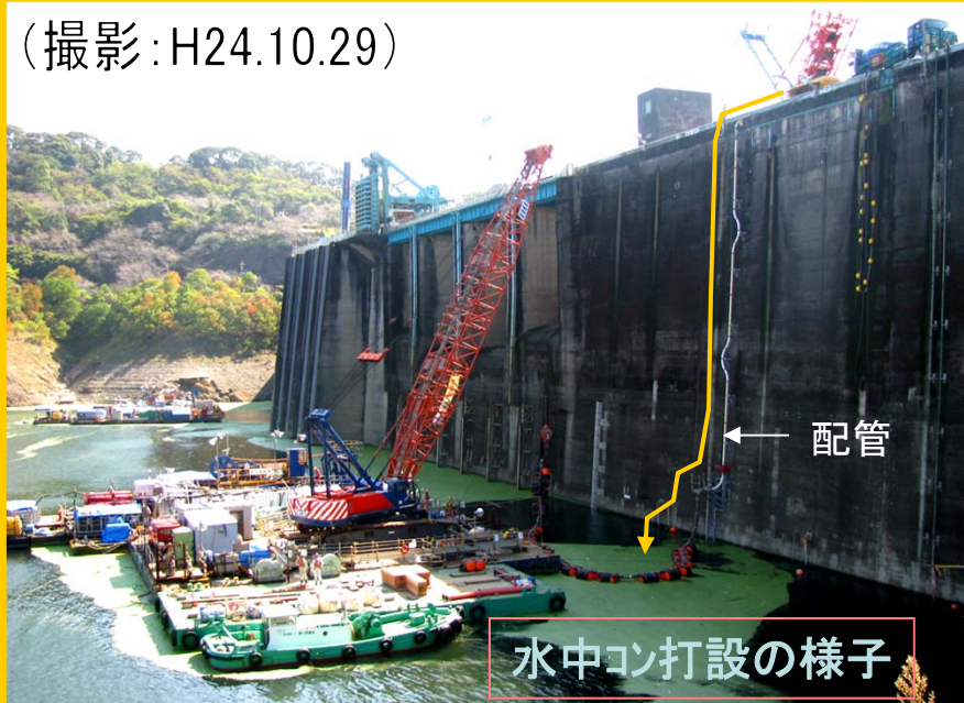
水中コン打設の様子