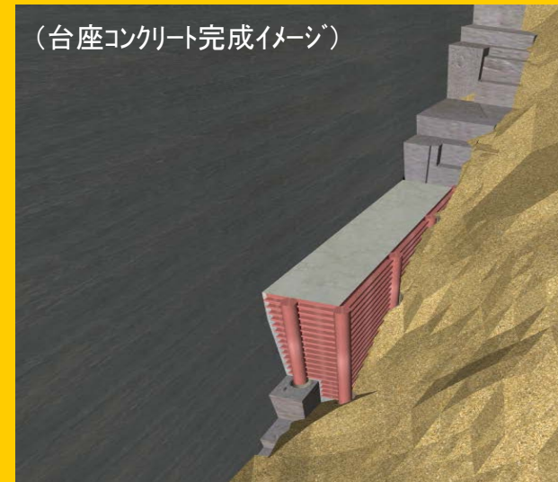
(台座コンクリート完成イメージ)

ダム天端に設置されたポンプを利用し、配管を通じて湖底の型枠内へとコンクリートを運びます。