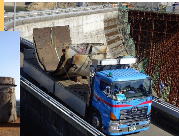
切断した既設発電管