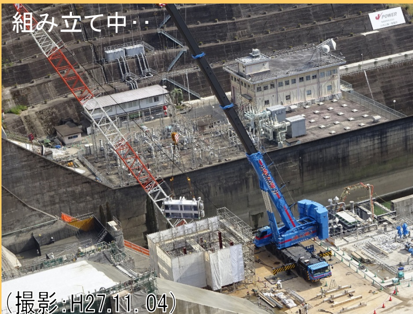
放流ゲート設置箇所