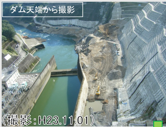
ダム天端から撮影