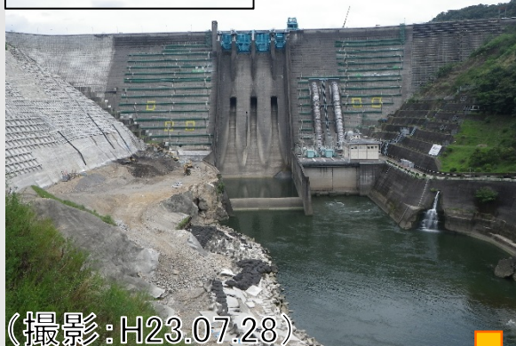
ダム下流から撮影