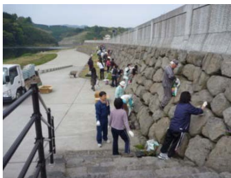
シバザクラの植樹