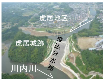
川内川下流から見た虎居地区

これらの一連の取り組みにより、今では市民が楽しみながら川への関心や防災意識を高めたり、地域の連携が強まってきました。