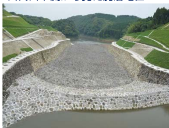
虎居城の石垣をイメージした分水路