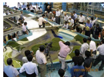
公開水理模型実験