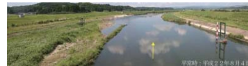
平常時：平成22年8月4日