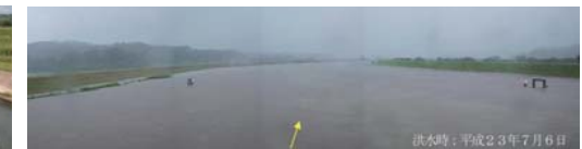
洪水時：平成23年7月6日