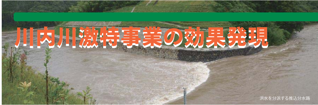
洪水を分派する推込分水路

平成18年7月の洪水を契機に実施された川内川激特事業は、地元との合意形成を踏まえ、工事実施されました。平成23年には、流域の一部で平成18年7月洪水と同規模の洪水も発生しましたが、川内川激特事業で整備された治水対策の効果が発揮されたことにより、外水（10ページ参照）によるはん濫被害をおおむね食い止めることができました。