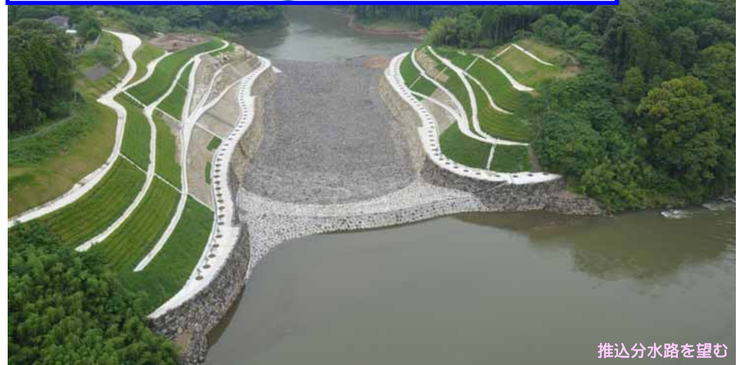
推込分水路を望む