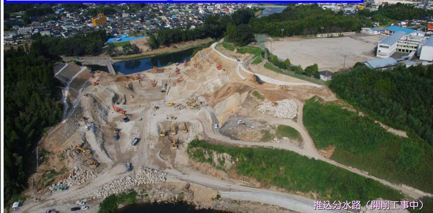
推進分水路(開削工事中)