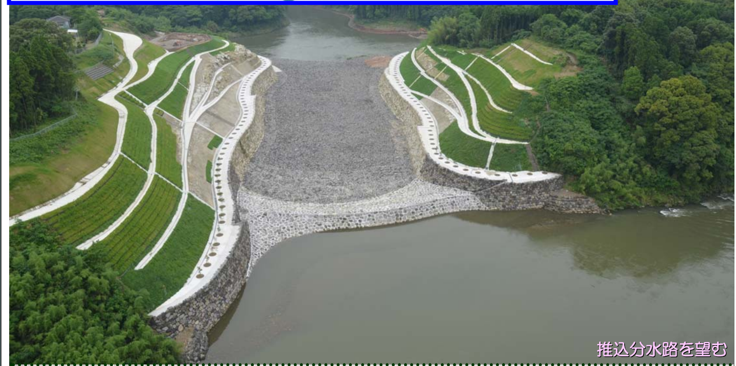
推込分水路を望む