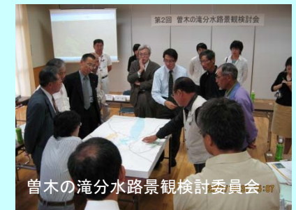
曾木の滝分水路景観検討委員会

こうした産官学民の連携による取り組みにより、曾木の滝分水路は、あたかも何千年も前からそこに存在したかのような景観となることができました。完成後は、地元住民やNPOにより、ウォーキング大会等のイベントが開催されるなど、地域振興にも貢献しています。グッドデザイン賞受賞にあたっては、こうした一連の経緯も高く評価されました。