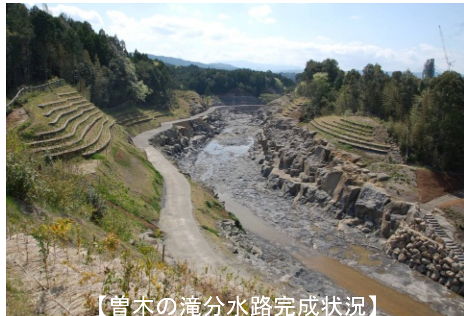
【曾木の滝分水路完成状況】