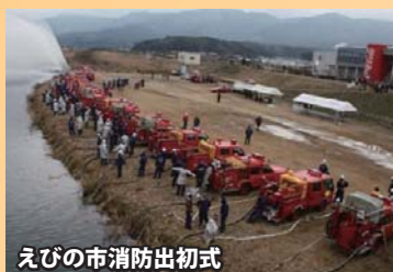
えびの市消防出初式