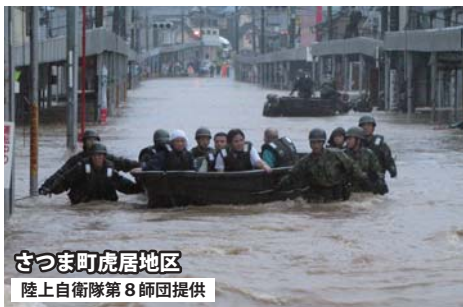
さつま町虎居地区