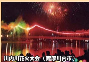
川内川花火大会（薩摩川内市）