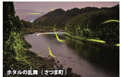
ホタルの乱舞 (さつま町)