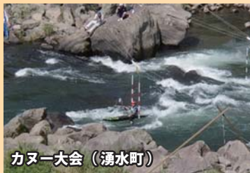
カヌー大会（湧水町）