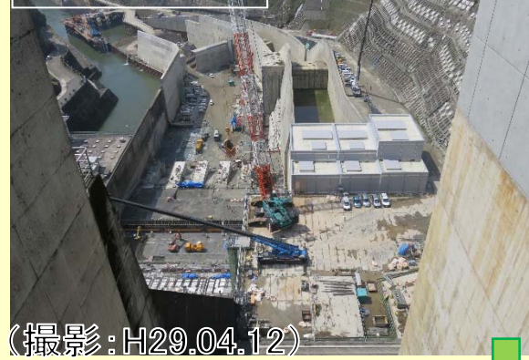
ダム天端から撮影