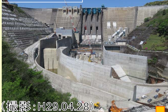
ダム下流から撮影