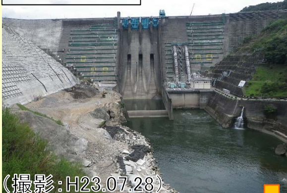
ダム下流から撮影