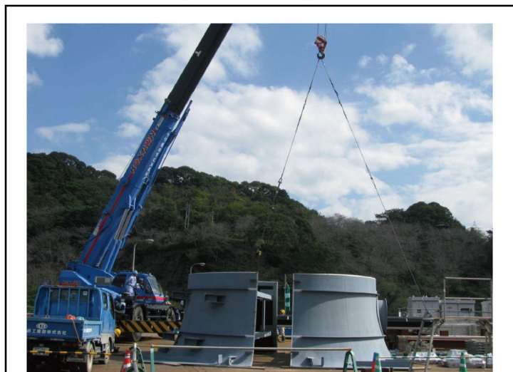
ベルマウス組立状況