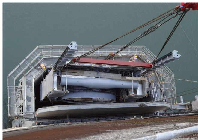
ベルマウス設置状況