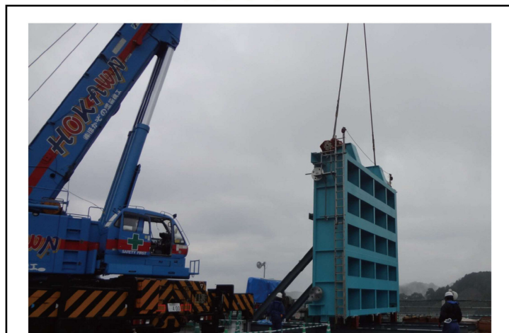
制水ゲート設置状況