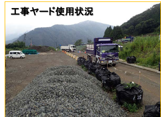
工事ヤード使用状況