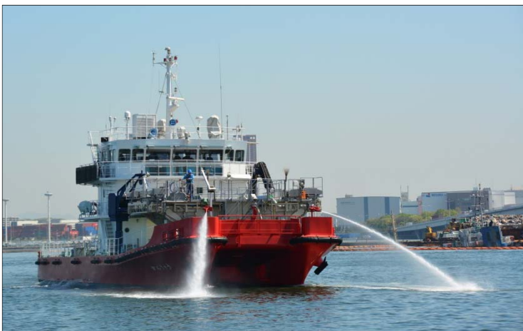
放水により浮流油を攪拌する「がんにりゅう」

博多港内の海域における浮流油の処理について、福岡市から要請されていた当面の作業が完了したため、「がんにりゅう」は北九州港に一旦帰港し待機します。