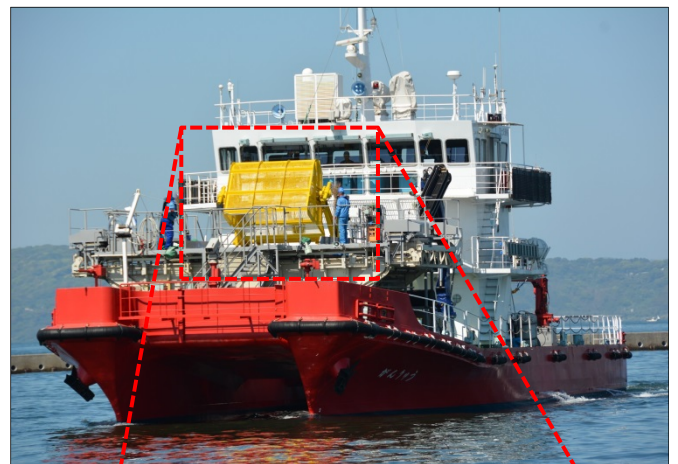
油吸着マット回収状況