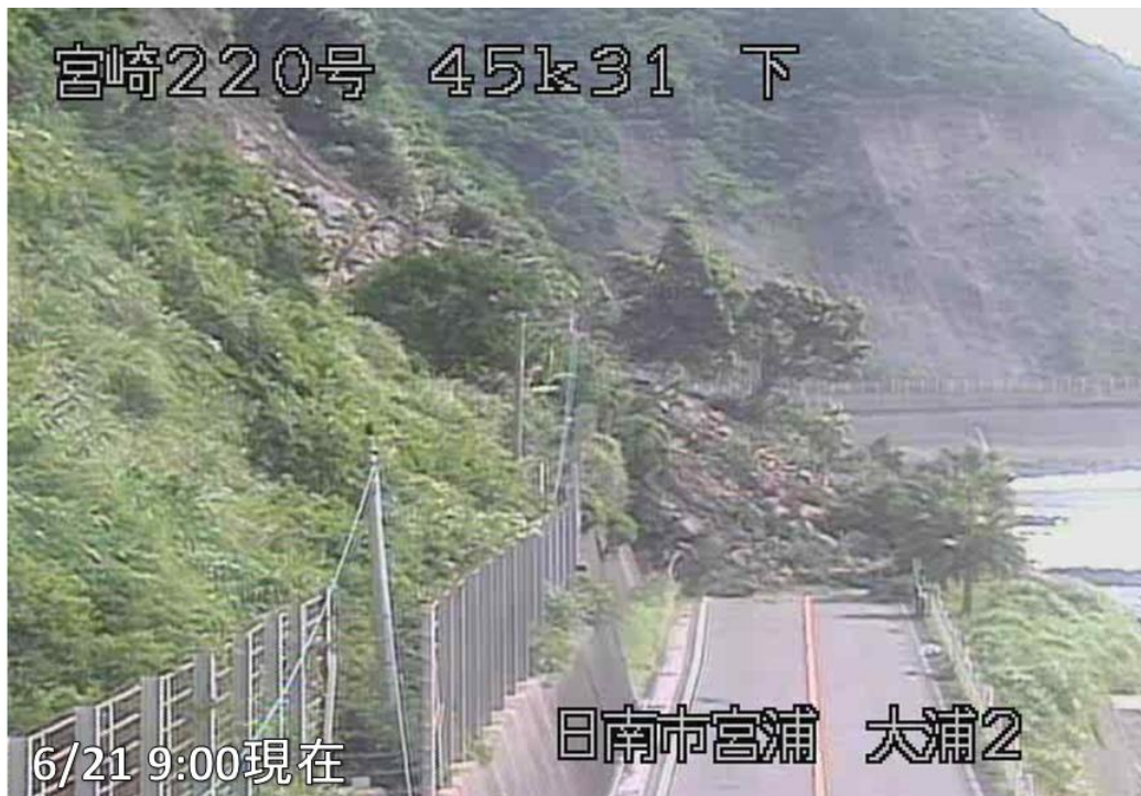
国道 220 号法面崩落現場（宮崎県日南市大字宮浦字大浦）の様子 （日南市方面から宮崎市方面を撮影）