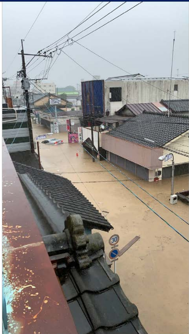
令和2年7月4日(土)朝撮影