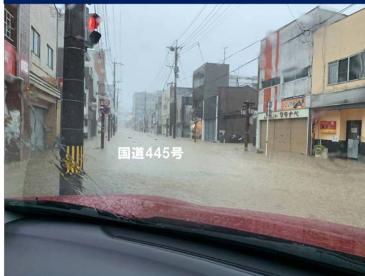
令和2年7月4日(土)朝撮影