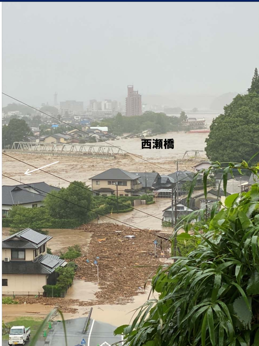
令和2年7月4日(土)朝撮影