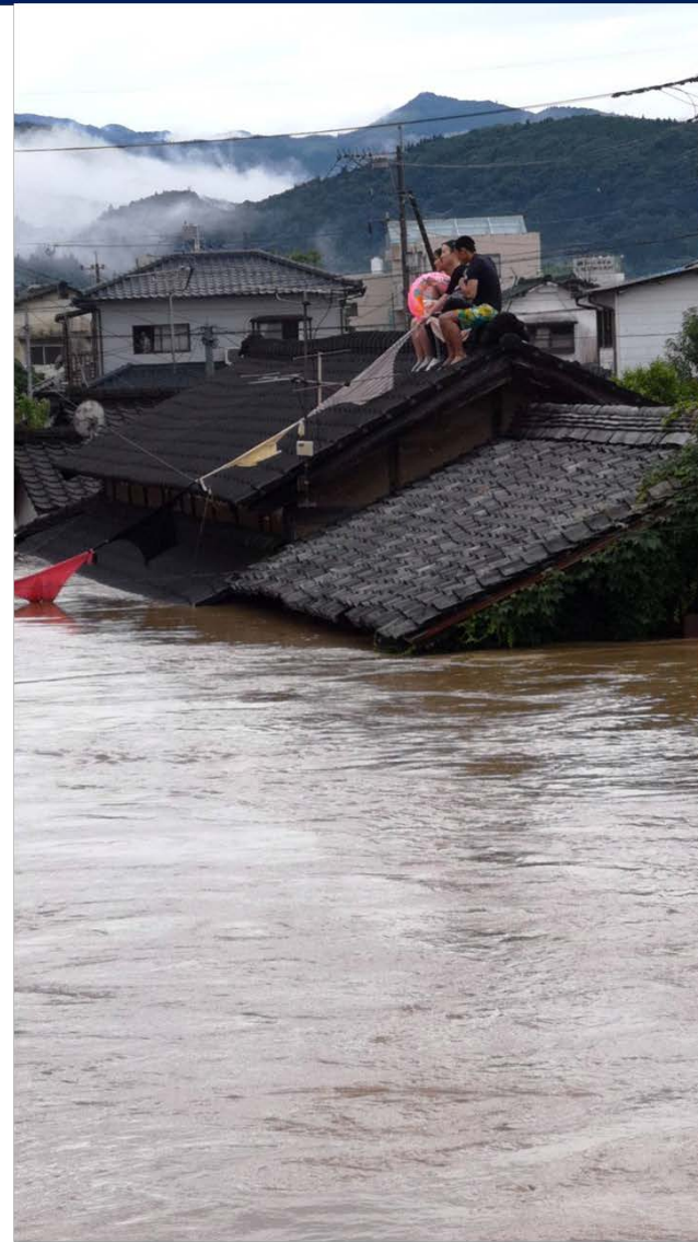
令和2年7月4日(土)午前中撮影