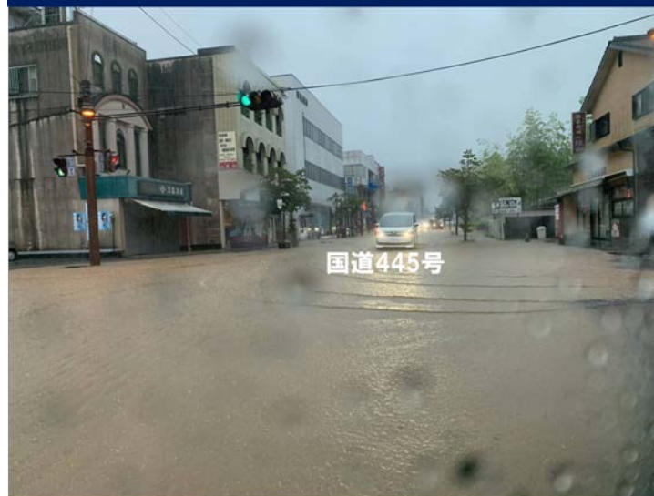
令和2年7月4日(土)朝撮影