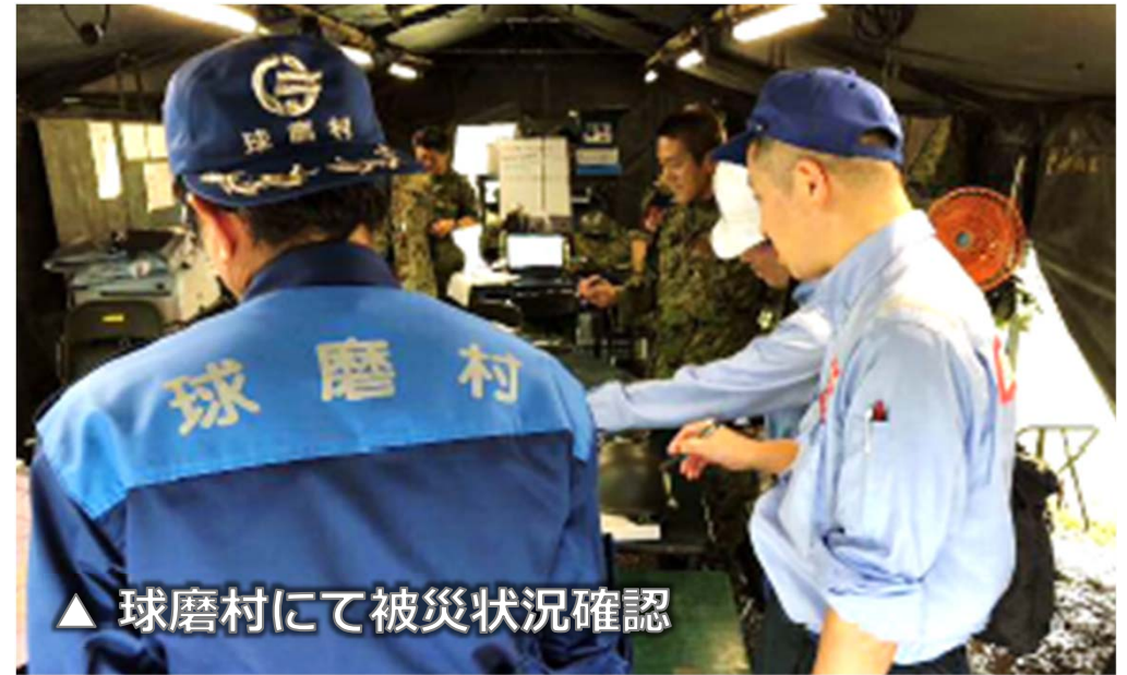
▲ 球磨村にて被災状況確認