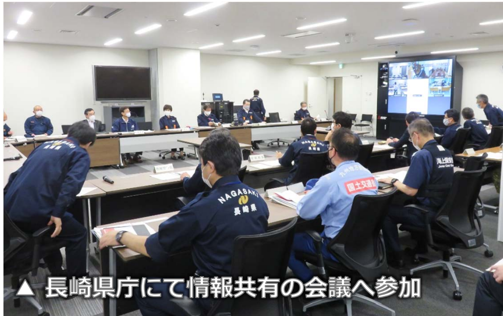
▲ 長崎県庁にて情報共有の会議へ参加

○ 県庁（熊本、大分、長崎、佐賀、福岡）、芦北町、水俣市、五木村、球磨村、鹿島市、人吉市、相良町、大牟田市、諫早市、みやま市へリエゾンを派遣。情報共有の会議へ参加、及び、被災状況を確認。