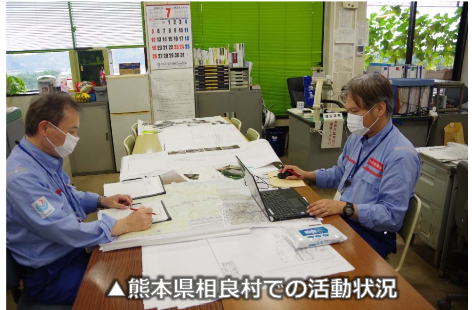
▲熊本県相良村での活動状況