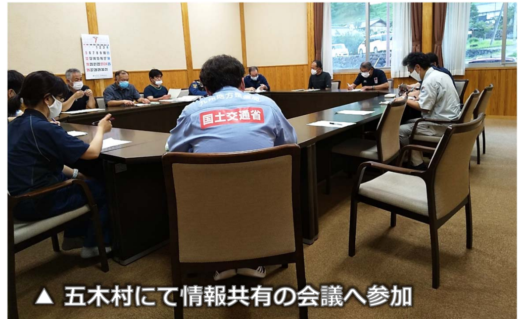
▲ 五木村にて情報共有の会議へ参加