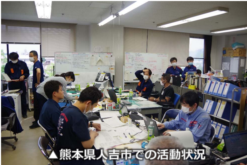
▲熊本県人吉市での活動状況