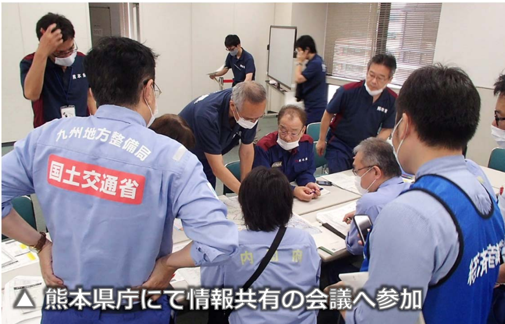
▲ 熊本県庁にて情報共有の会議へ参加