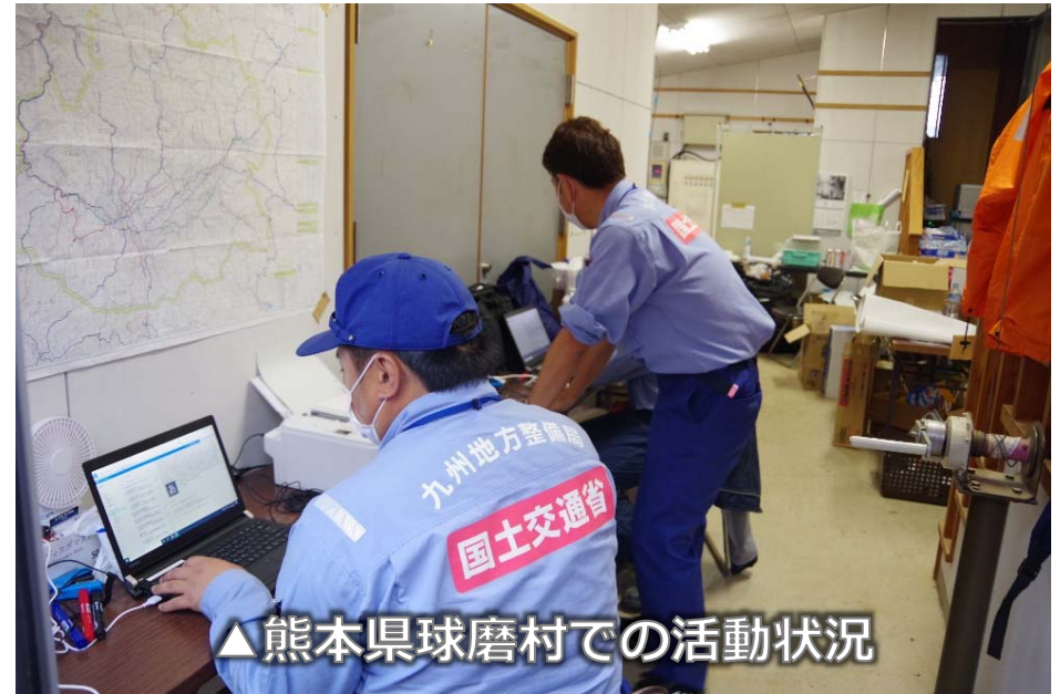
▲熊本県球磨村での活動状況