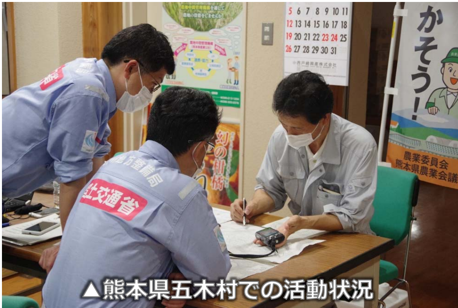
▲熊本県五木村での活動状況