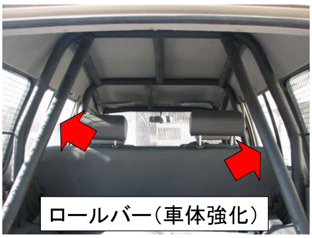
ロールバー(車体強化)