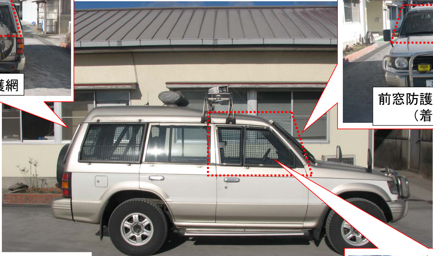
△ロールバー(車体強化)及び 側窓防護網装着状態 (宮崎河川国道事務所保有)