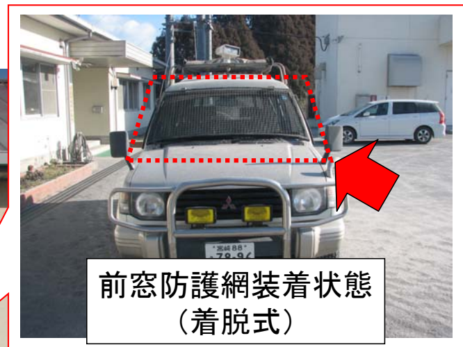
前窓防護網装着状態 (着脱式)