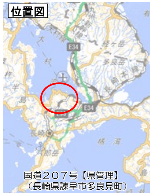
国道207号【県管理】 (長崎県諫早市多良見町)