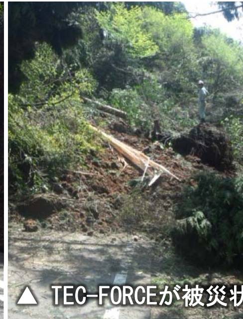
▲ TEC-FORCEが被災状況を調査後、土砂撤去