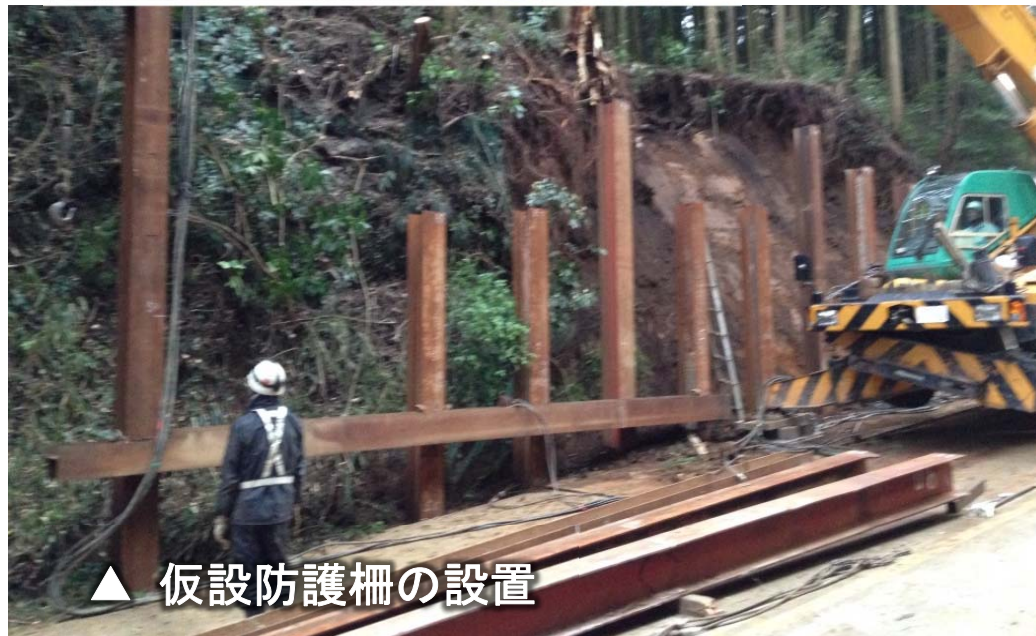
▲ 仮設防護柵の設置