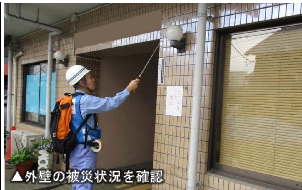
▲外壁の被災状況を確認