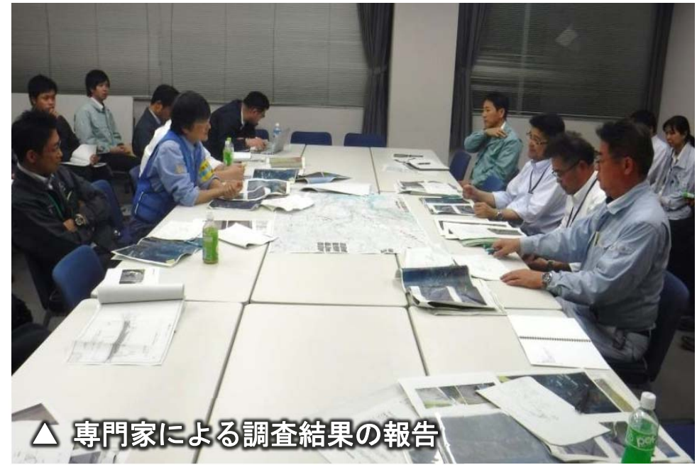
▲ 専門家による調査結果の報告