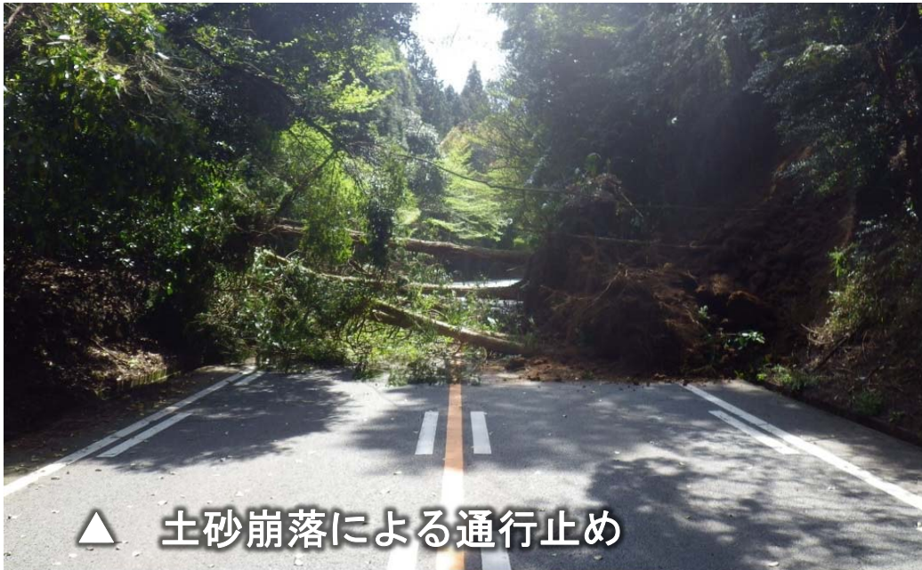
▲ 土砂崩落による通行止め

○ 平成28年4月22日(金)土砂崩落により通行止めの「県道北外輪山大津線：二重峠交差点～菊池阿蘇スカイライン(ミルクロード)」において、TEC-FORCEによる復旧に向けた技術的指導や工事監督支援等により迅速に復旧作業が完了し、熊本方面から阿蘇・大分方面の大型車通行可能な東西軸を確保