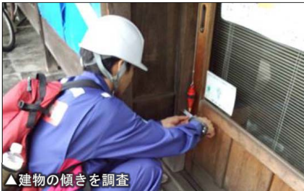
▲建物の傾きを調査