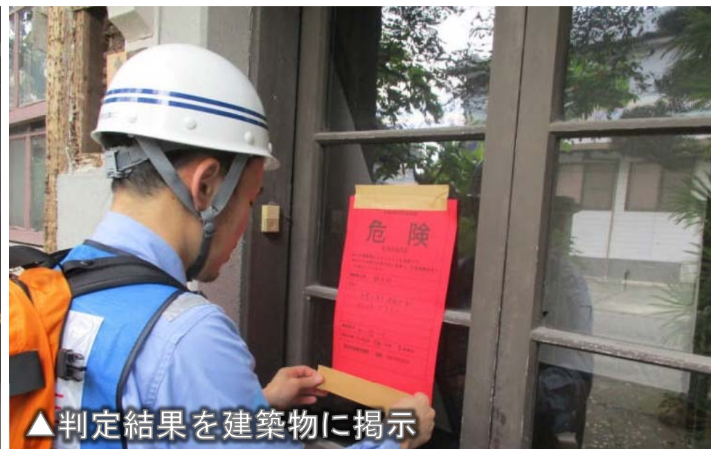
▲判定結果を建築物に掲示