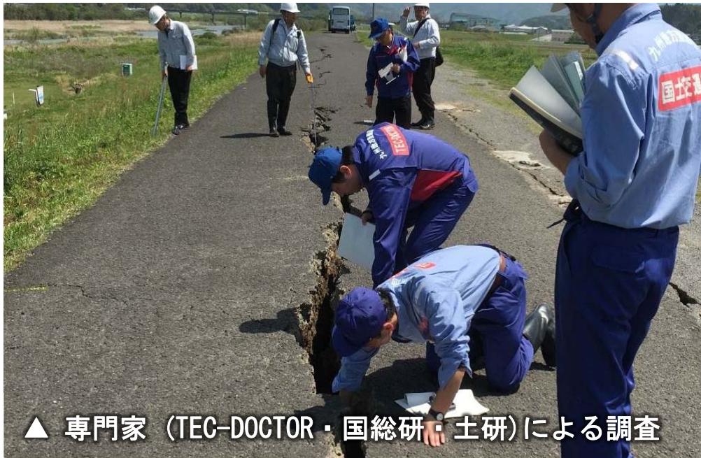
▲ 専門家 (TEC-DOCTOR・国総研・土研) による調査

○ 平成28年4月15日(金)～ 熊本地震により被災した白川や緑川の被災状況を調査するため、ただちにTEC-DOCTORを派遣。地震翌日から順次、緊急復旧工事を実施