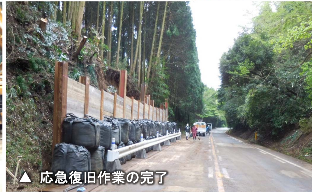
▲ 応急復旧作業の完了