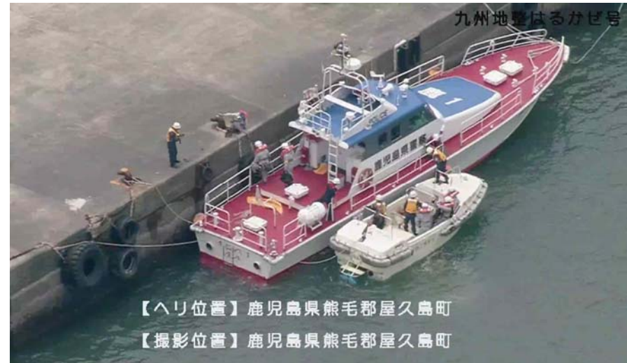
▲「はるかぜ」による一時入島の映像配信