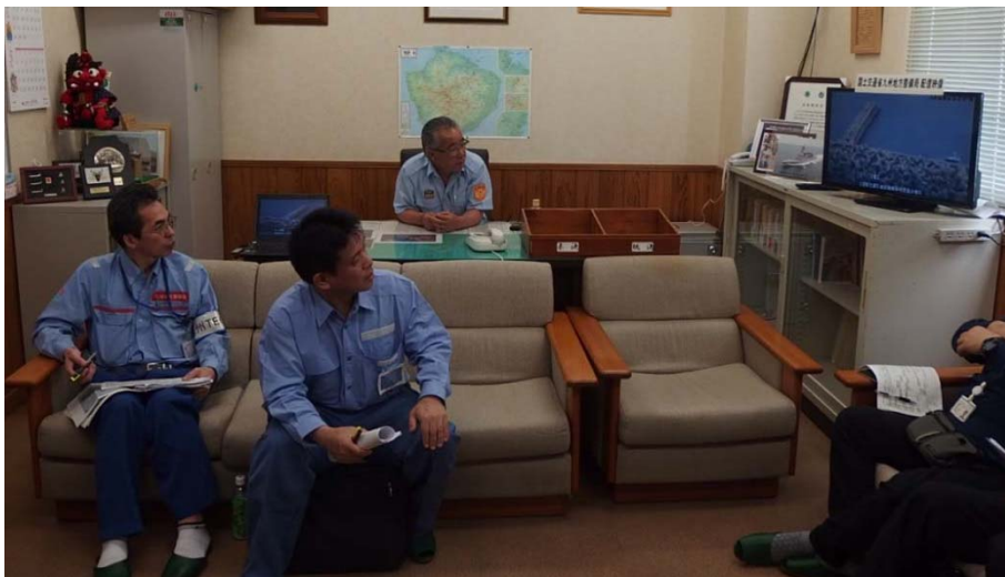
▲「はるかぜ」からの映像で一時入島の様子を確認する屋久島町長