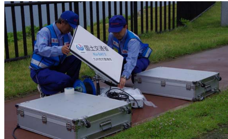
▲Ku-SAT(衛星通信装置)を設置し、映像を受信