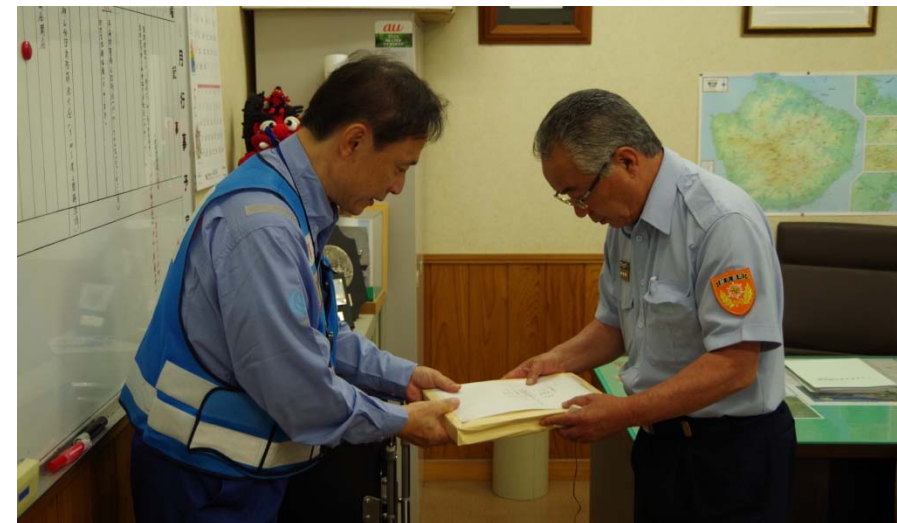
▲防災へり「はるかぜ」からの録画映像や写真を屋久島町長に提供