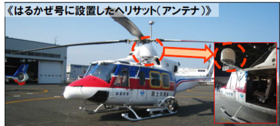
▲ヘリサット(アンテナ)から映像を通信衛星へ配信