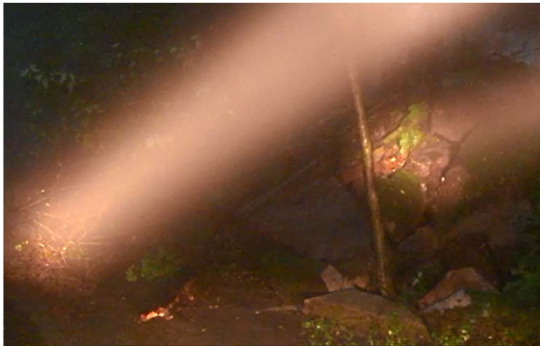
▲ 小型パトロールカーのサーチライトを使用し崩壊状況を調査