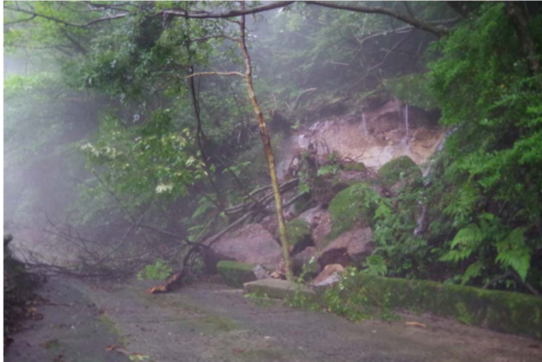
▲ 屋久島中継所の連絡路でのり面崩壊を確認