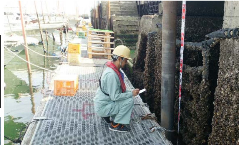
▲潮位変動を考慮するため、潮位観測を実施。

○深浅測量は、航路部及び泊地部を合わせて約1,000,000m 2 の範囲を実施。(熊本港に入港する船舶に影響する異常箇所は確認されなかった。)