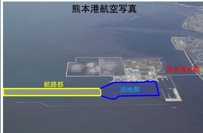
▲深浅測量範囲(航路部・泊地部)