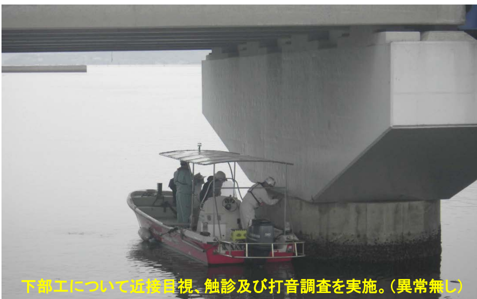
下部工について近接目視、触診及び打音調査を実施。(異常無し)