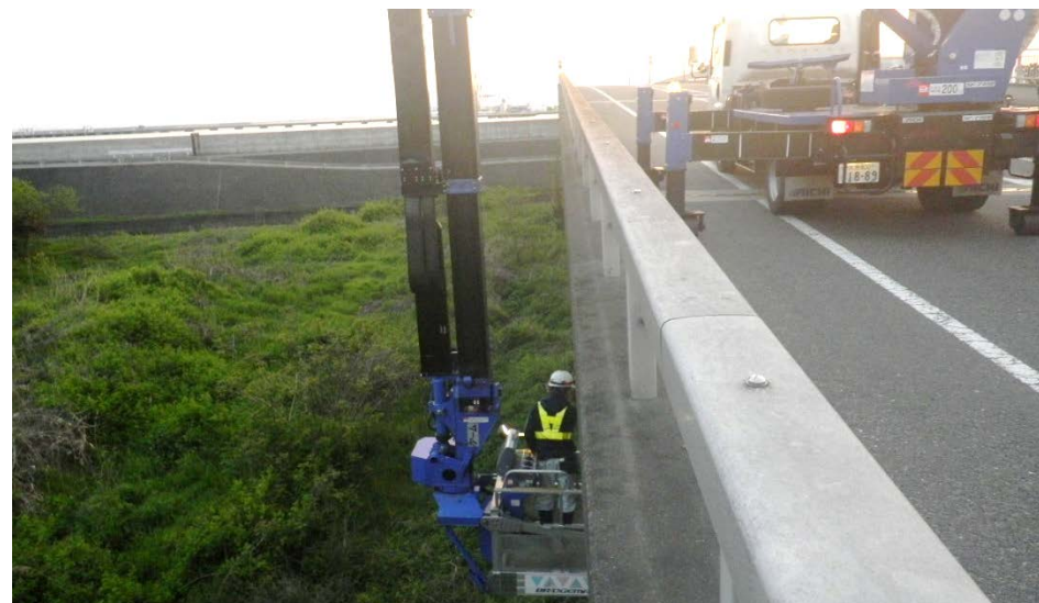
▲上部工について橋梁点検車両車を用いて点検を実施。(異常無し)