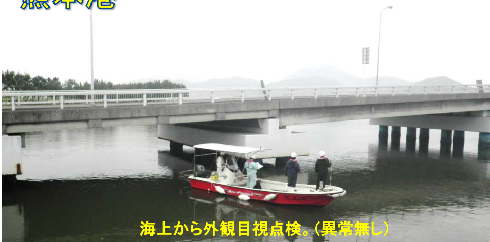
海上から外観目視点検。(異常無し)